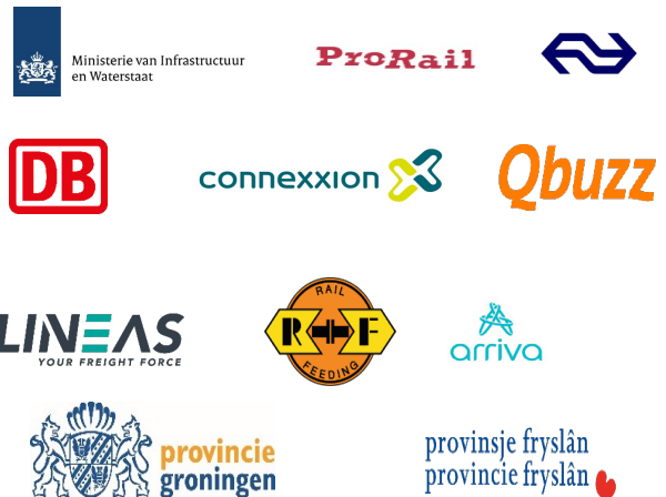
Figuur 1. De sectorambitie voor de ontwikkeling van ATO

Auteurs: Jan Willem de Kleuver, Joost Boudewijns, Chris Stam, Sjoerd Sjoerdsma, Harmen van Schaik